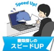
書類処理のスピードUP