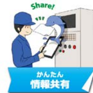
かんたん情報共有