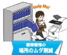
書類整理の場所のムダ削減

なおご入会対象は、D. D. ユーザーさま(経営者+経営幹部+全ての社員)、D. D. ファンの方々、そして3Sに取り組む企業・改革に関心のある企業さまです。 →詳細はこちら!