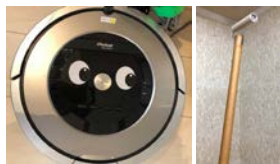
↑ルンバは目をつけキュートに♪