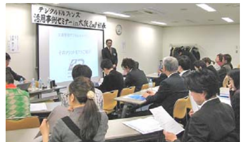
セミナー風景。地元大阪以外にも、東京、京都等から総勢40名近い方にご参加頂きました。

共伸技研さんのD.D.の画面。右側には、お客さまからの手書きFAX用紙が、データ化されたものがあります。