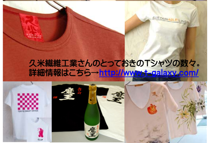
久米繊維工業さんのとっておきのTシャツの数々。詳細情報はこちら→ http://www.t-galaxy.com/