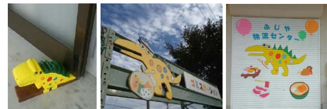
手作り＆手描き！「玄関扉のストッパー」、ゴミステーション、シャッター