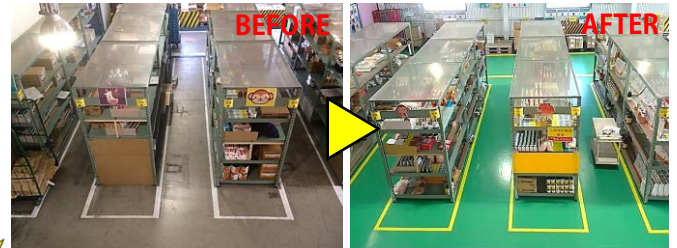
「安心・安全・快適な職場づくり」の一環として、念願だった床塗装を実現！