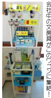
会社中の文房具がこのワゴンに集結！