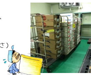
かご台車を使うと一度に多くの荷物をついで移動出来ます