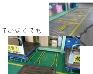
レーン設置！台車が元に戻りやすくなる