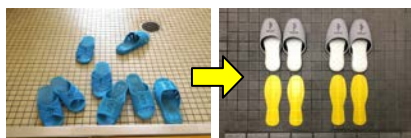
影絵（黄色表示）を設置すると自動的にスリッパが揃う