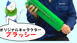
オリジナルキャラクター ブラッシャー