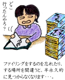
ファイリングをするのを忘れたり、する場所を間違え、半永久的に見つからなくなります…。

インターネット経由でも営業をするようになって、お客さまが激増! 2008年当時、見積りベースで2,000~3,000件、レポートで800件程あり、紙書類が膨大な量になり、お客さまから頂いた資料や図面(紙書類)をファイリングする手間が大きな負担となって、デジタルドルフィンズ(D.D.)導入前は、一週間分の紙書類を手作業でファイリングするのに半日も費やしていました。また、その膨大な紙の中から、必要な情報を見つけ出す時間と労力も増加の一途を辿り、紙書類という“アナログ管理”に限界を感じました…。