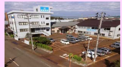
遠藤電機株式会社さま社屋外観

遠藤電機株式会社さま(新潟県長岡市)は1940年に変圧器のコイルの巻替えを生業に創業、その後電気工事・盤製造・製品販売と業態を広げていきました。仕事に対する姿勢や考え方を高める取り組みを通して、弱電から強電まで電気の専門会社として、積み重ねてきた経験と技術で一致団結し、真剣にお客様のご依頼に応えることによって、地域、社会の豊かな未来に貢献し、選ばれる会社であり続けておられます。